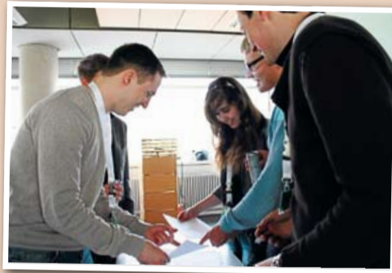
Der Debattierclub der WFI hatte alle Hände voll mit der Organisation der Süddeutschen Meisterschaft zu tun und stellten als Gastgeber kein Team.

gerschaft und Krankheiten ist“, so ihr Argument: „Sex ist nicht da zur Belustigung wie es in Pornos praktiziert wird, sondern zur Fortpflanzung.“ Jonas bleibt bei so viel Unterstützung von der Gegenseite nur noch die Bekräftigung der Argumente seiner Vorrednerin und die Zusammenfassung der bisherigen Argumente. Dazu benötigt er so viel Zeit, dass für ein neues Argument kein Raum mehr ist und er sich Minuspunkte für Zeitüberschreitung einhandelt. Das kreidet auch die Jury in der Feedbackrunde an.